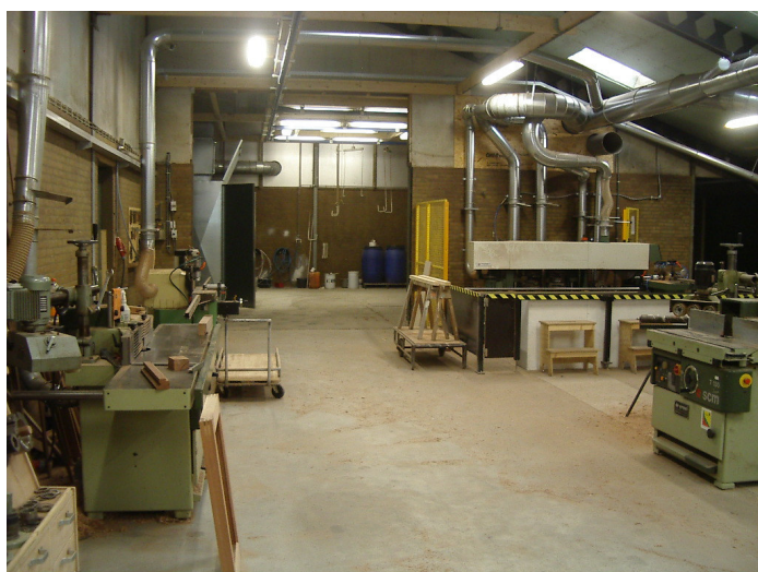
Bedrijfshal De Specht Machinale timmerwerken

Wij hopen u op termijn meer informatie te kunnen verschaffen. Natuurlijk kunt u altijd contact met ons opnemen, indien u vragen hebt.