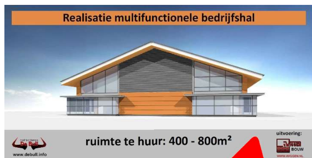
Foto: impressie van gebouw 6